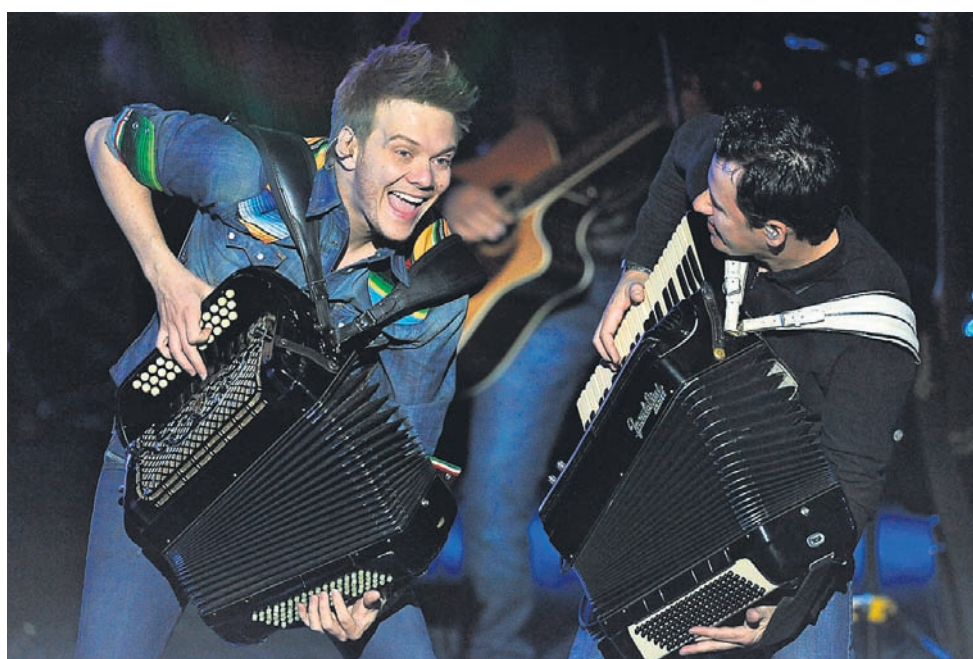
Мишел Тело исполняет сертанежу — простую сельскую музыку, которая благодаря ему стала новой музыкальной модой во всем мире.

Так было и в Crocus City Hall. Правда, в качестве задника певец использовал экран, транслировавший как картинку из зала и крупные планы музыкантов, так и специально подготовленные видеоряды. Но видео не было решающим моментом сцениграфии. Важнее простецкая внешность героя и общее ощущение неподдельной провинциальности происходящего. В какой-то степени сценическое действие Мишела Тело можно соотнести с французской Заз. В ролях, обеспечивших ей популярность, тоже на первом месте был не постановочный раз-