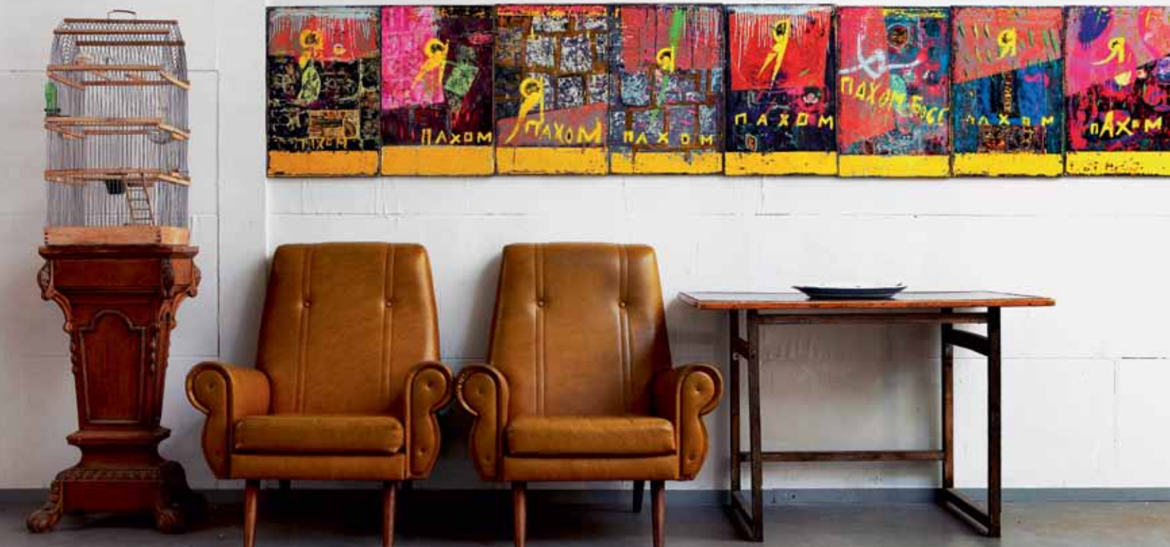
Экспозиция в мастерской меняется каждую неделю. Под серией «Я – Пахом» из коллекции галереи Саатчи – винтажные голландские кресла и птичья клетка на постаменте XIX века.